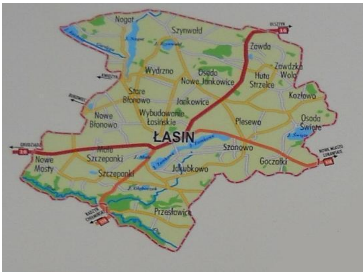
Rysunek 2. Główne drogi w Mieście i Gminie Łasin